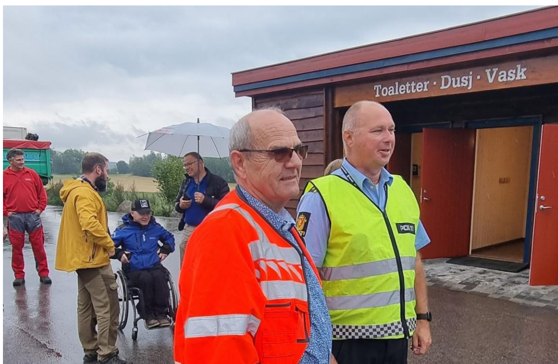
Radarparet fra Statens vegvesen og politiet er enige om at gode fasiliteter for yrkessjåfører er viktig å satse på.

bergingsbil iverksettes. Uavhengig av forsikringselskaper og bergingsavtaler skal den som er raskest til hendelsesstedet håndtere situasjonen basert på politiets instruks. Hensikten er å lede trafikken forbi ulykkesstedet raskest mulig slik at bruk av omkjøringsveier som ofte er lite egnet for store kjøretøy kan unngås. Bergingsbil skal være underveis omtrent samtidig med nødetatene, selv om hverken behov eller avtale- og forsikringsmessige forhold er fullstendig avklart. Politiet og Statens vegvesen er samstemte i sitt ønske om at fokuset i de nye rutinene skal føre til en mentalitetsendring. Kortest mulig veistengningstid skal være et av målene til dem som opererer på et skadested. Liv, helse, sikkerhet og klokka skal være de elementene som skal ligge i ryggmargen til alle involverte mannskaper.