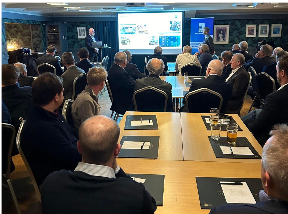
Regionsjef og fylkesleder informerer om NLF sitt arbeid

Samarbeidspartnere som deltok var Scania, Volvo/Volmax, Bertel O. Steen/Mercedes, MAN og If Forsikring.