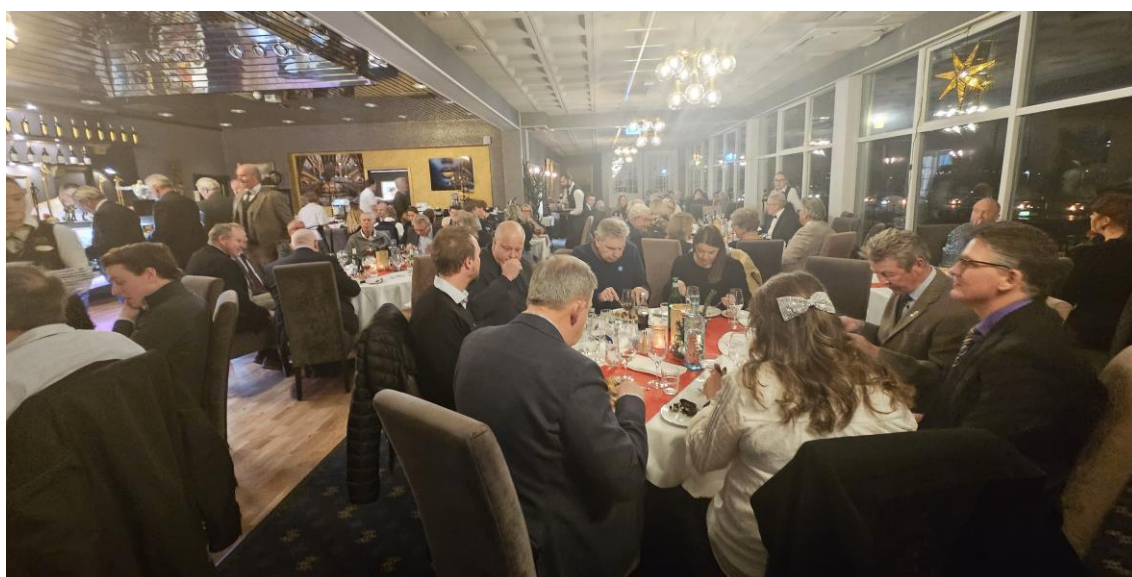
Grand Hotel Åsgårdstrand har en utmerket julebuffet som medlemmene setter pris på